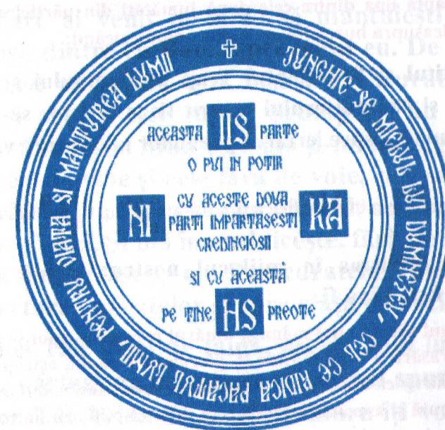
Așezarea Sfântului Agneț pe Sfântul Disc, după frângere

După aceasta, diaconul, lăsând vasul de căldură, stă puțin mai deoparte, iar preotul rupe (sau taie cu copia) păticea HS în două, pe Sfântul Disc.