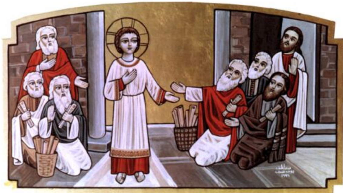
Icoană coptă a Înjumătățirii