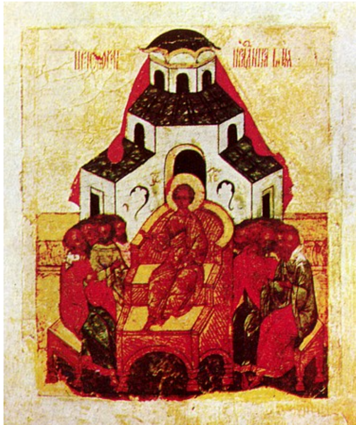
Icoană rusească a Înjumătățirii